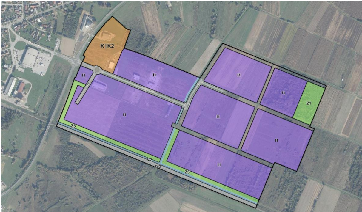
Prikaz Izmjena i dopuna UPU 6 zone gospodarske namjene na području Ivanić-Grad i Caginec (1. Namjena prostora)

S obzirom na to da VIII. Izmjene i dopune Prostornog plana Zagrebačke županije nisu donesene u trenutku izrade ovih izmjena i dopuna, nije bilo potrebe za usklađivanjem s istima odnosno izmjenom planskih rješenja na temelju PPŽ-a.